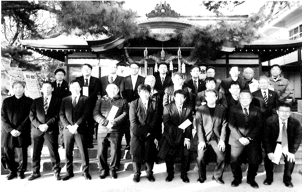
令和7年度加古川労働基準協会安全祈願

編集と発行 加古川労働基準協会 広報部 〒675-0031 加古川市加古川町北在家2006番地永田ビル4階 ☎079-421-0102 FAX079-421-7601 E-mail info@kakogawa-kyoukai.com https://www.kakogawa-kyoukai.com/ No.683 令和8年3月1日